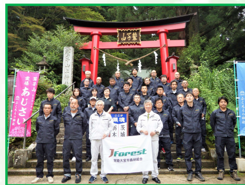
常陸大宮市森林組合