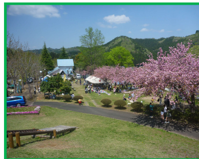
やすらぎの里公園 管理運営