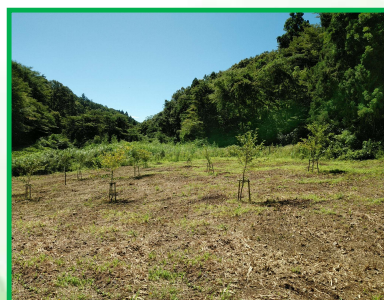
おがわふれあいの森・桜管理