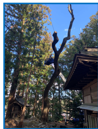
高所作業車による伐採