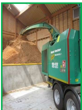
木質バイオマスチップ製造 施設 管理運営