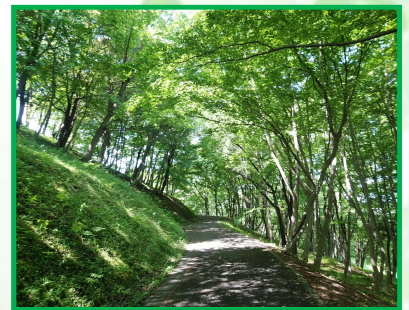
西部総合公園緑地 管理