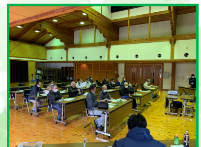
常陸大宮市森林経営管理意向調査