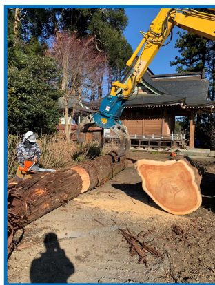
丸太の造材・集材