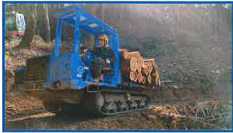
フォワーダによる運搬