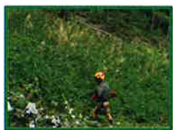
( 植付け・下刈り )