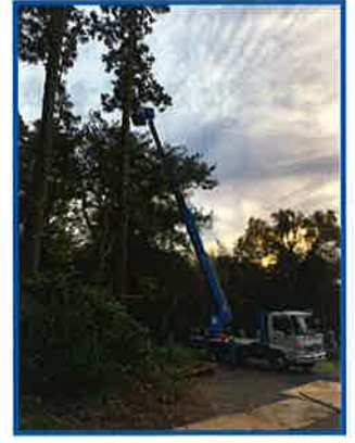
高所作業車による伐採