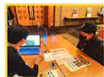
( 森林経営意向調査・林業就業ガイダンス )