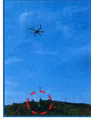
ドローンの苗木運搬