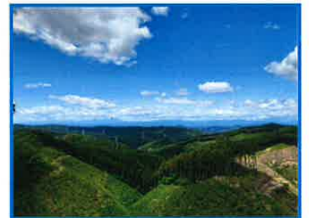
自然広がる常陸大宮市