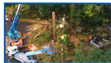
( 支障木伐採 )