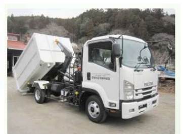
アームロールダンプ